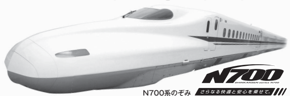
N700系のぞみ さらなる快適と安心を凝らせて!!

■旅行代金/往復のぞみ号 普通車指定席(岡山-新大阪)利用 大阪-ホテルオークス新大阪宿泊 シングル(1名1室)おとなお一人様 1泊2日食事なしの場合